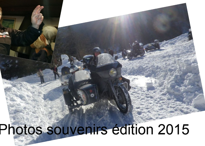
Photos souvenirs édition 2015

Nous vous attendons de nouveau en février 2016, en plein cœur des Hautes-Vosges pour ce rassemblement rustik entre kopains.